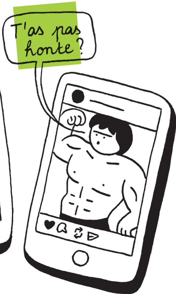
Illustration : Céleste Maurel

N'hésitez jamais à venir échanger avec l'équipe lors de vos passages. Ces moments partagés comptent beaucoup pour nous et nourrissent profondément le projet.